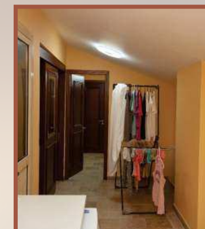
ΟΤΔΕΛΥΝΗ ΚΟΜΝΑΤΑ ΔΥΛ ΠΕΡΣΟΝΑΛΑ

...α οσταλύνη ζα χαςηκώι κωφε ηο-Κυπρσκι.