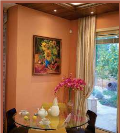
ΟΡΙΓΙΝΑΛΥΝΗ ΧΥΔΙΟΤΕΣΤΗΝΗ ΠΟΛΩΤΝΑ