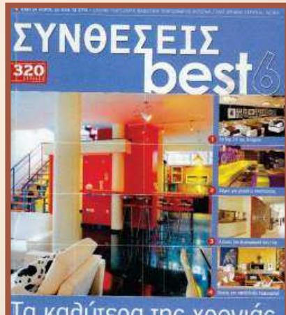
Τα καλύτερα της χρονιάς ΛΥΧΣΗΙ ΔΟΜ ΚΙΠΡΑ ΠΟ ΒΕΡΣΙΟΙ ΙΥΡΝΑΛΟ