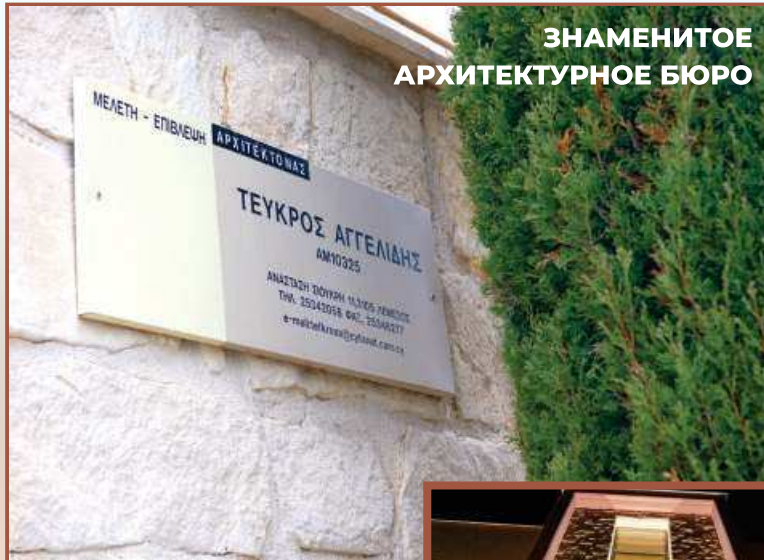
ЗНАМЕНИТОЕ АРХИТЕКТУРНОЕ БЮРО