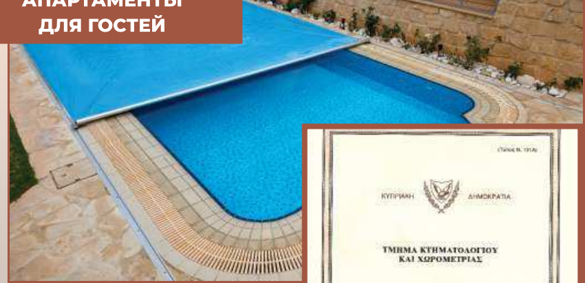
ΠΡΟΔΛΕΒΑΕΜ ΣΕΖΟΝ ΟΤΔΥΧΑ Β ΧΙΣΤΟΤΕ Ι ΥΙΟΤΕ