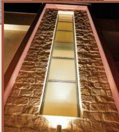
ΕΚΣΚΛΥΖΙΒΝΗ ΟΤΔΕΛΚΑ ΚΑΜΝΕΜ