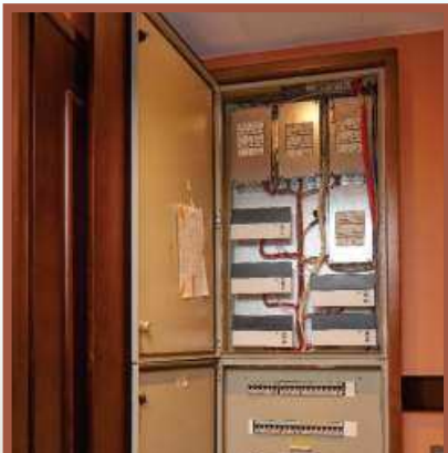
ТОЛЬКО САМОЕ НАДЕЖНОЕ И КАЧЕСТВЕННОЕ В ИНЖЕНЕРИИ