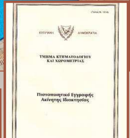
ΔΟΚΥΜΕΝΤΑ ΝΑ ΔΟΜ Ι ΖΕΜΕΛΥΝΗ ΥΧΑΤΟΚ